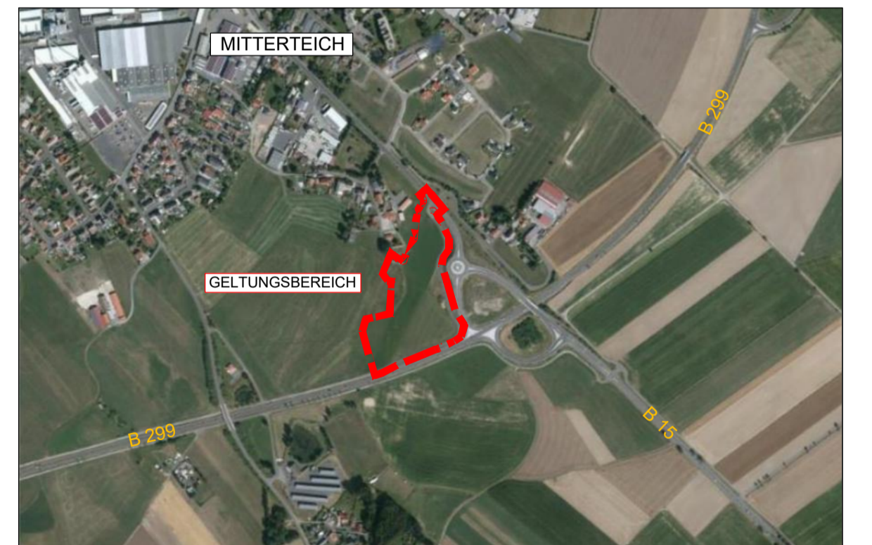
Übersichtslageplan, M 1:10.000

FLUR NR.: 627/2, 628/2 (TF), 628/7 (TF), 629, 636, 636/4, 640/1 (TF), 712/5, 712/6 und 712/7 DER GEMARKUNG MITTERTEICH