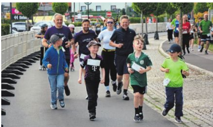
Auch die Prominenz wagte sich auf die 1,2 Kilometer lange Strecke.