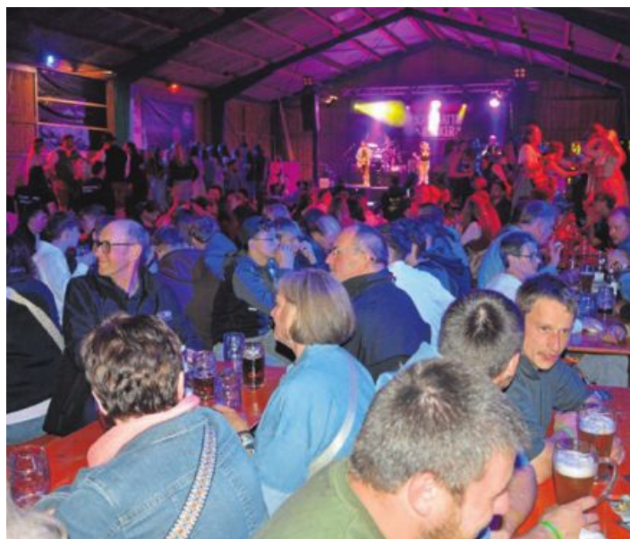
Blick in die prächtig gefüllte Festhalle. (jr)