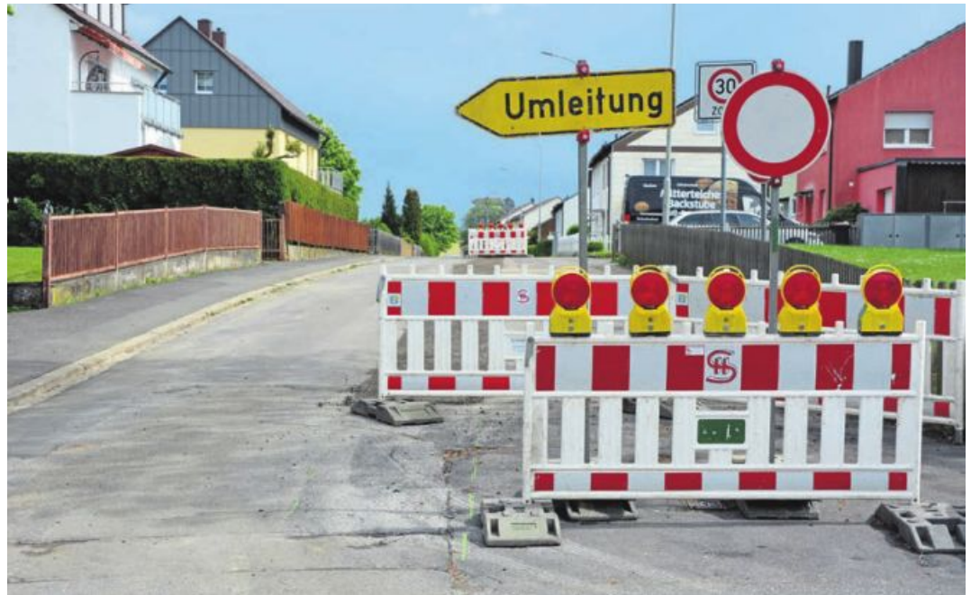
Erste Arbeiten haben auch in einem Teilabschnitt der Wiesenstraße begonnen.