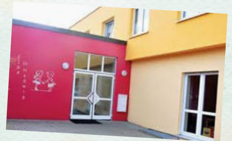
Kindergarten St. Hedwig Wiesenstr. 44 Tel. 09633/1435