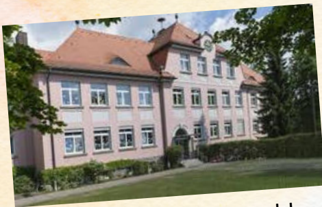
Kinderhaus "Die kleinen Hankerler" Waldsassenerstr. 3 Tel. 09633/1691

Es freuen sich Die Teams der 3 Kinderhäuser