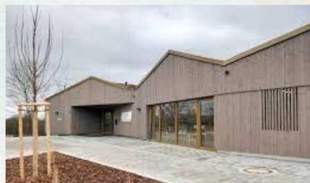
Kinderhaus "Purzelbaum" Pechofenerstr. 56 Tel. 09633/9339020