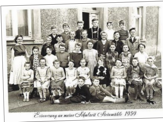
Wer ist wer? Auch bei anderen Fotos aus dem Vereinsleben, der Schulgeschichte oder den Steinbrüchen rätselten die Besucher gerne, wer damals alles dabei war: hier die Klassen 4 und 5 im Jahr 1959.

Friedrich Wölfl nahm „Sieben Jahrzehnte Dorfschule“ in den Blick. Er zeichnete die Vorgeschichte nach, dann den Bau der Schule 1903 sowie das Geschehen bis zum Neubau 1964. Sein Fazit: Die Schule war wohl 70 Jahre lang mitentscheidend für den gesellschaftlichen Zusammenhalt der Ortschaften und unterschiedlichen Milieus. Sein nächstes Thema war „Aufstieg und der Niedergang des Bahnhofs Steinmühle“. Die vielen Fotos zur