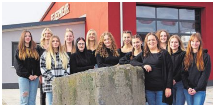
Dreizehn Festdamen bereichern das 125-jährige Gründungsfest der Feuerwehr Pleußen. (jr)