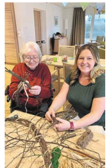
Durch eine Vielzahl an Beschäftigungsangeboten sorgt die Tagespflege dafür, dass die Gäste aktiv bleiben.

Für Fragen steht die Leitung Anja Ackermann unter a.ackermann@caritas-tirschenreuth.de oder Tel. 09633/6619448 zur Verfügung. Bei Frau Ackermann können auch kostenfreie Schnuppertage für die Tagespflege „Zanklgarten“ in Mitterteich vereinbart werden.