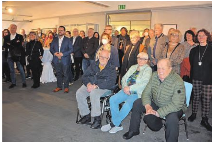
So viele Besucher zur Ausstellungseröffnung waren schon lange nicht mehr gekommen.