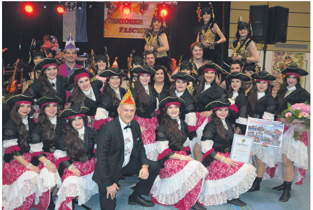
Bürgermeister Roland Grillmeier (Mitte) dankte den beiden Showtanzgruppen „X-Dream“ (vorne) und „Phoenix“ (im Hintergrund) für viele tolle Jahre der Unterhaltung. Beim 41. Seniorenfasching wurden sie verabschiedet, nachdem beide Gruppen mit Ende der diesjährigen Faschingssaison ihre tänzerischen Karriere beenden. (jr)

Grillmeier wusste, dass beide Vereine, der Gaudiwurm und der TuS, immer wieder neue Talente herausbringen. X-Dream und Phoenix dankte er für viele Jahre des Trainings, die sie für ihr Hobby opferten. „Applaus ist des Künstlers