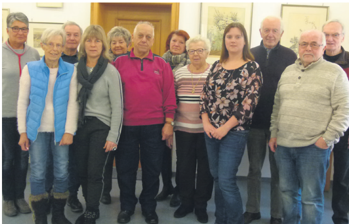
Seniorenbeirat der Stadt Mitterteich

In jeder Ausgabe des Tafels erscheint ab sofort eine Übersicht über die Veranstaltungen des Seniorenbeirats.