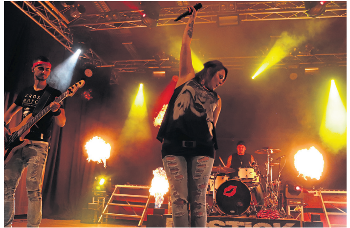
Die Party-Rock-Coverband „Lipstick“ macht am Samstag, 30. Juni Station bei „Rock in StaaZ“ am Festplatz in Großensterz. Die Jugend und Junggebliebenen dürfen sich auf einen spannenden Abend mit Rockklassikern und Hits aus den Charts freuen. (jr)

Weiter geht es einen Tag später, am Sonntag, 1. Juli, wenn die Wehr zum Gartenfest mit Zeltbetrieb in den Biergarten am Spielplatz (Dorfmitte) einlädt. Ab 10 Uhr startet der Frühschoppen, ab 11.30 Uhr gibt es Mittagessen (Schnitzel mit Salate). Am Nachmittag locken selbstgebackene Torten und Kuchen auf den idyllischen Festplatz. Während die Eltern in entspannter Atmosphäre den Festnachmittag genießen können, stehen für die kleinen Besucher eine Hüpfburg, Kinderschminken und viele