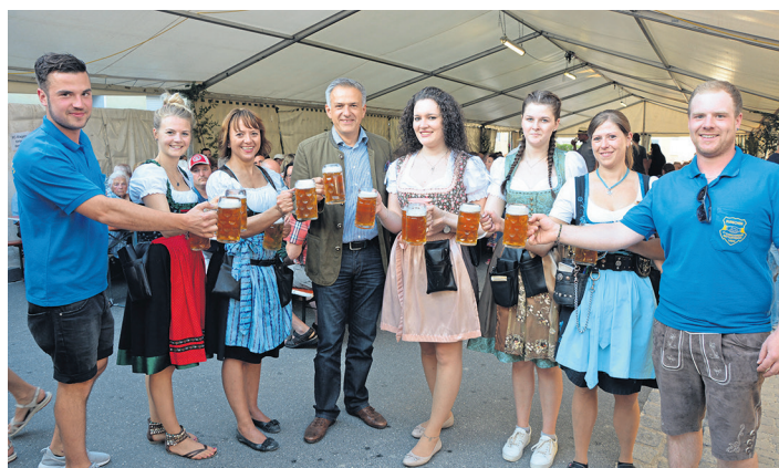
Mit einem vollen Haus rechnen die Organisatoren des 15. Mitterteicher Zoiglfest am 7./8. Juli im ältesten Stadtteil der Stadt, am Anger. Für alle Fälle steht ein Festzelt bereit, ansonsten ist es eine Open-Air-Veranstaltung. (jr)

10 Uhr mit dem Frühschoppen und den „Drei Scheinheiligen“ aus Marktredwitz. Ab 11.30 Uhr wird Mittagessen (Schweinebraten mit Spoutzn und Kraut), serviert. An beiden Tagen gibt es die bekannt deftigen Grillspezialitäten, deftige Zoiglbrotzeiten, sowie am Sonntagnachmittag Kaffee und Kuchen. Ab 17 Uhr spielt die Mitterteicher Stadtkapelle auf. Das Fest findet bei jeder Witterung statt, für alle Fälle steht ein Festzelt bereit. Schirm-