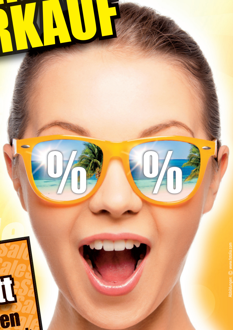
Abbildungen: © www.foto123.com