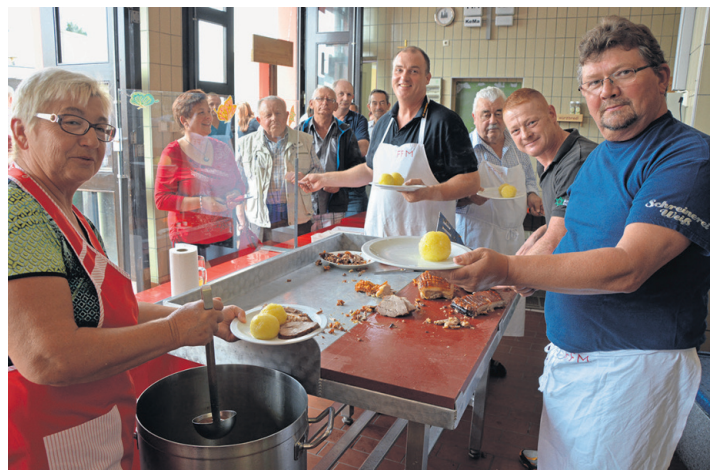
Mittags bleibt die Küche kalt, bei der Feuerwehr gibt Schweiners, Spoutzn und Graad. (jr)

Dotsch und Grillspezialitäten. Auf die Kinder warten ab 14 Uhr Rundfahrten mit den Feuerwehrautos, eine Tombola, sowie ein Glücksrad. Highlight ist eine Schatzsuche im großen Sandkasten, wo allerlei Überraschungen versteckt sein werden. Den ganzen Tag ist die Kolpingstraße für den Durchgangsverkehr gesperrt. Die Bevölkerung ist herzlich eingeladen, das Sommerfest findet bei jedem Wetter statt.