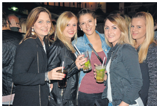
Auch diese Mädels ließen es sich am Samstagabend gut gehen.