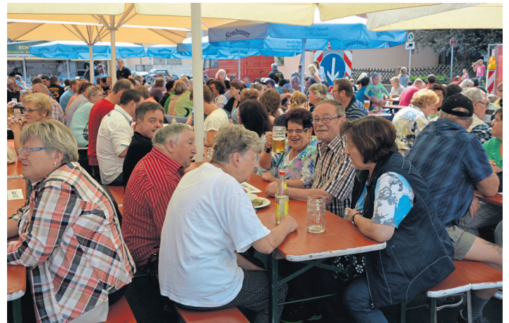
Alljährlich besuchen Hunderte von Besuchern dieses Traditionsfest. (jr)