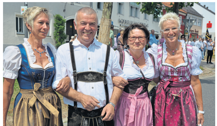
Hoch lebe der Mitterteicher Zoigl und die Damenwelt. (jr)