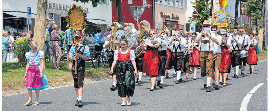
Die Stadtkapelle Mitterteich führte den Festzug an.