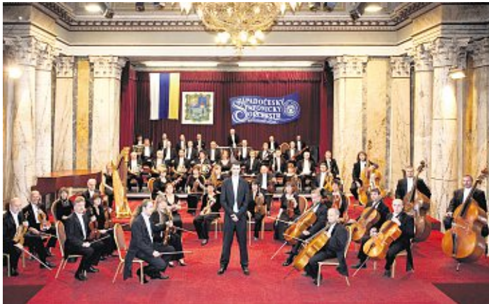
Das Westböhmische Symphonieorchester Marienbad (unser Bild) gastiert zum Neujahrskonzert am 5. Januar in der Mitterteicher Mehrzweckhalle zum Neujahrskonzert. Beginn ist um 19.30 Uhr.