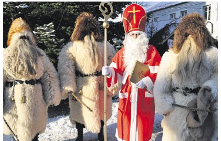
Auch heuer stellen wieder der Burschenverein und die Pfadfinder die Nikolauspaare. (jr)

öffnet hat das Alte Rathaus, wo sich die Schnitzer gerne über die Schulter blicken lassen. Korbflechter geben Einblicke in ihre Arbeit im Mehrgenerationenhaus und der Frauenbund bietet seine Waren im Pfarrhof an. Zusätzlich gibt es im Mehrgenerationenhaus selbstgebackenen Kaffee und Kuchen. Natürlich ist auch die Malkreisausstellung im Kellnerhaus ein Besuch wert. Aufgebaut ist wieder das Eingangstor zum Weihnachtsmarkt, ein gern gesehener Blickfang. Ernstberger hofft, dass auch heuer wieder der traditionsreiche Mitterteicher Weihnachtsmarkt seine Anziehungskraft behält und viele Besucher die Urigkeit und Gemütlichkeit schätzen. Bleibt nur zu wünschen, dass Frau Holle noch ein paar weiße Flocken gen Erde sendet.