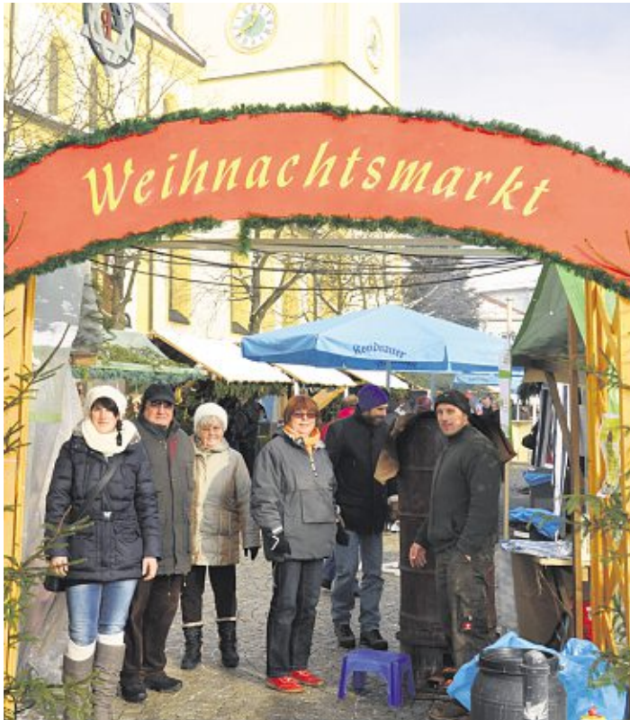
Das Tor zum Weihnachtsmarkt lädt zum Besuch zwischen Historischem Rathaus und Stadtpfarrkirche ein. (jr), Bild: jr

Mitterteicher Weihnachtsmarkt am 7. Dezember – Von 13 bis 20 Uhr – Vierzig Weihnachtsbuden