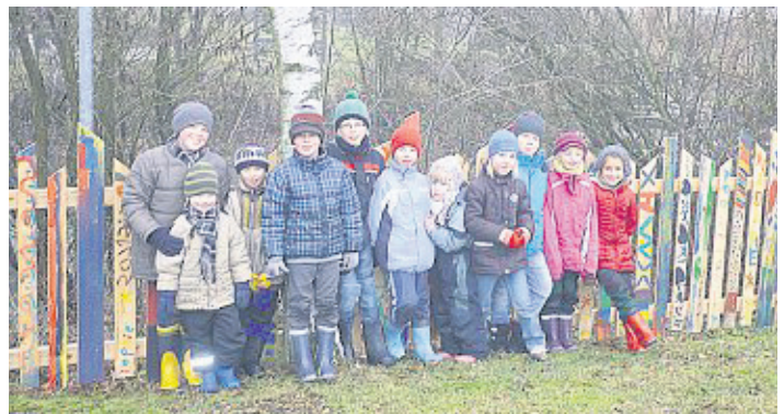
Der neu gestaltete Zaun beim Kreislehrgarten, mit einigen Kindern der Jugendgruppen des Obst- und Gartenbauvereins Mitterteich. Sie treffen sich jeden zweiten Samstag dort zur Gruppenstunde.

geladen, im Rahmen des Ferienprogrammes ihrer Kreativität freien Lauf zu lassen und Zaunlatten anzumalen. Nun endlich war Zeit, die kleinen Kunstwerke anzubringen. Kinder, die ihre Zaunlatte (be) suchen wollen, sollten Ihre Eltern zu einem kleinen Ausflug in den Kreislehrgarten animieren.