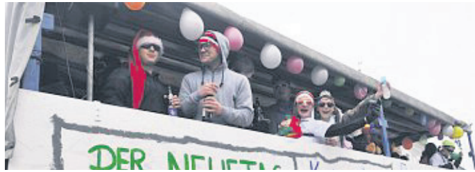
In Leonberg hat es sich ausgegelt. (jr)

grüßte. Stark vertreten die närrischen Gruppen des ATS Mitterteich, die an der Spitze des Gaudiwurms marschierten. Egal ob Showtanzgarde (toll als Indianer-Squas), Kindergruppen oder das lustige Völkchen der Piraten, sie alle machten eine tolle Figur. „Sind die Hirsche in Tirschenreuth flüchtig, wird die Feuerwehr wichtig. Ganz gezielt und mit Elan, hüpfen wir dann an“, stand auf dem Faschingswagen der Feuerwehr. Sie spielten damit auf das flüchtende Dammwild bei Themenreuth an. „Waldsassener es hilft nichts mehr, a Tunnel mou her“, wurde auf die fast unendliche Geschichte der Waldsassener Umgehung angespielt. Baubeginn? Neben den Motivwägen war eine Vielzahl von Fußgruppen unterwegs. Mit dabei die beiden Kindergärten der