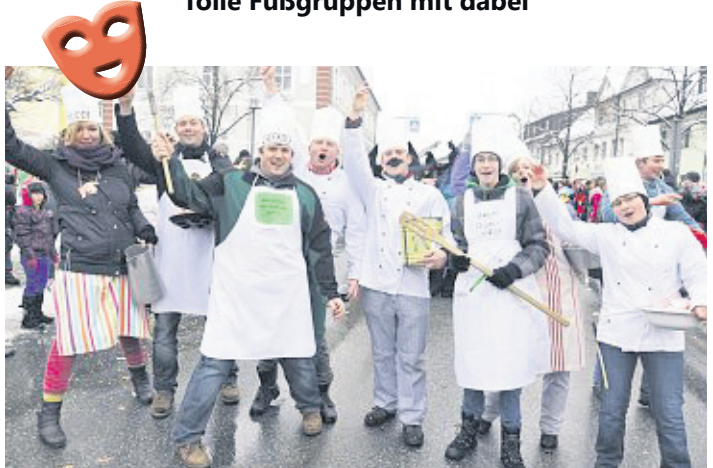
Die Großensterzer Kochbuchautoren. (jr)

Tausende Besucher beim 6. Mitterteicher Gaudiwurm – Tolle Fußgruppen mit dabei